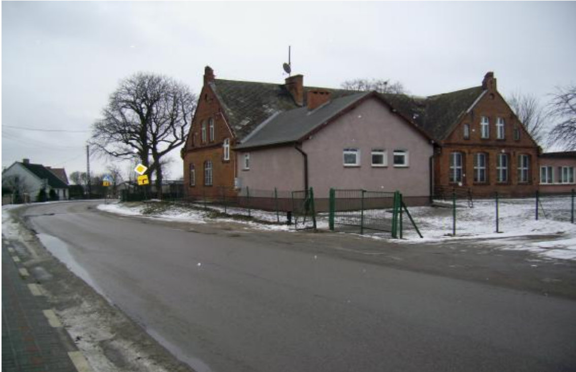
Rys.2. Widok na wieś

Natomiast na rysunkach 2, 3 i 4 zawarto zdjęcia wybranej części wsi wraz z widokiem świetlicy.