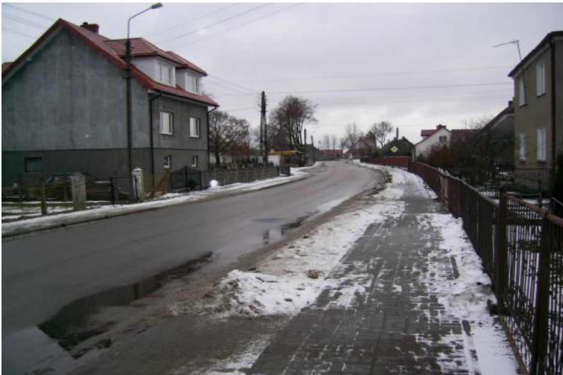
Rys.3. Widok na wieś